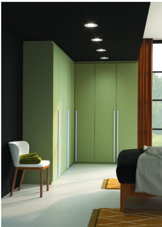
Couldoor Dressing pistache avec poignée élan inox brossé L1 200 mm