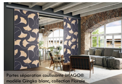
Portes séparation coulissante IMAGO® modèle Gingko blanc, collection Florale

Pour plus d'informations : www.coulidoor.fr