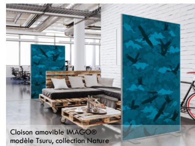
Cloison amovible IMAGO® modèle Tsuru, collection Nature