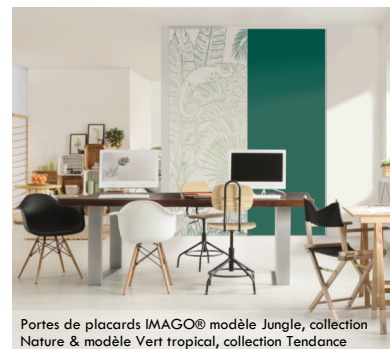
Portes de placards IMAGO® modèle Jungle, collection Nature & modèle Vert tropical, collection Tendance

Le concept Imago® offre des arguments séduisants pour attirer les jeunes architectes à la recherche d'innovations et d'idées originales, en accord avec les exigences parfois strictes des cahiers des charges. En laissant libre cours à leur créativité, Imago® est une toile idéale pour exprimer leur vision architecturale.