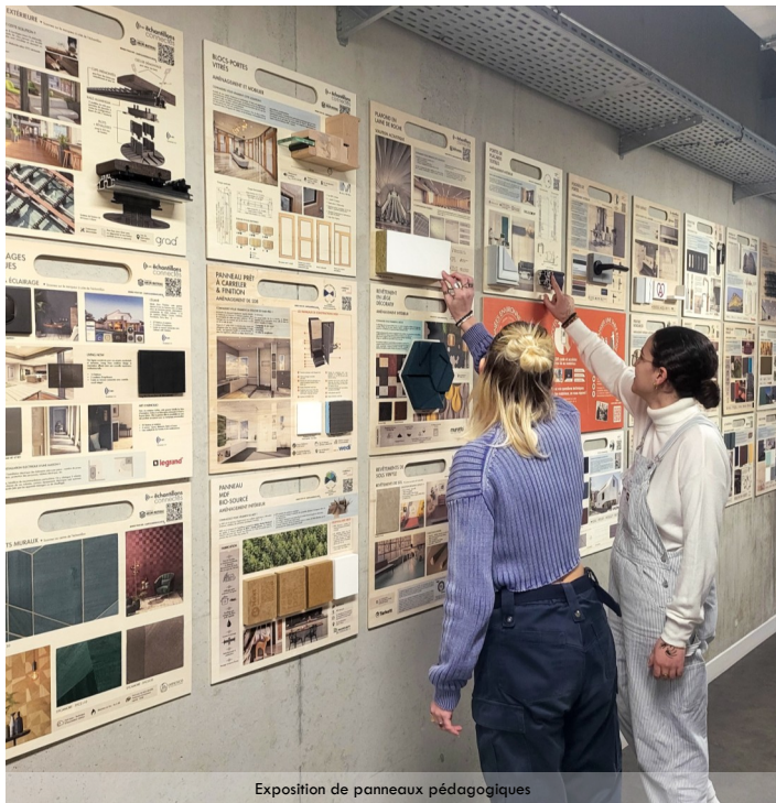
Exposition de panneaux pédagogiques