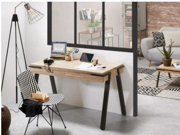
Un bureau adossé au couloir du salon

Pour travailler un peu ou beaucoup, ranger ses papiers ou poser son ordinateur, le bureau est indispensable. Voici 25 idées astucieuses pour aménager chez soi un petit coin bureau aussi discret que pratique.