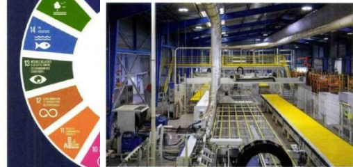
Le groupe Gautier a structuré sa démarche RSE avec le label Lucie. Guilou

Source : Laurence Roure, responsable des marchés professionnels et du développement de la RSE au sein de l'Ameublement français.